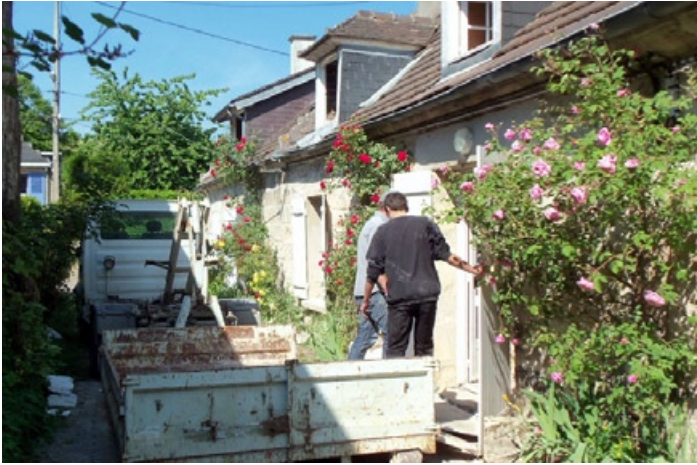
Travaux au Rameau