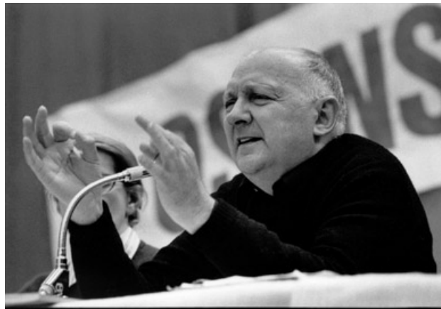
Père Joseph Wresinski

Je relis en ce moment un livre du Père Joseph Wresinski, mort il y a quelques années. Un bon ami de L'Arche qui a fondé Agir pour Tous dans la Dignité Quart Monde ou ATD Quart Monde* – un mouvement de soutien pour les personnes marginales, rejetées, humiliées. Le but n'est pas de les aider d'abord matériellement mais de les aider à trouver une véritable perception d'eux-mêmes comme être humains, à retrouver confiance en eux-mêmes. Le Père Joseph aimait dire (et c'est le titre de ce livre) « Les pauvres sont l'Eglise ». Ce sont ceux qui crient leur misère qui sont proches de Dieu et Dieu est proche d'eux. Pour le Père Joseph, il s'agissait d'abord de les rencontrer avec humilité, de prendre du temps avec eux en les écoutant avec un grand respect en voyant en eux un don et une présence de Dieu. Ce livre m'a rappelé des souvenirs quand le Père Joseph venait nous parler à L'Arche: comment il faut être converti pour être avec les humbles de la terre, en se souvenant des paroles de Dieu données à travers Isaïe (57,15)