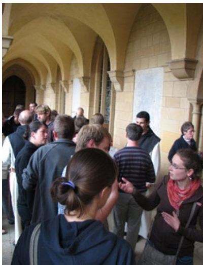
Jeunes en retraite à Orval

Mon séjour de paix au monastère d'Orval a commencé par un Boum !