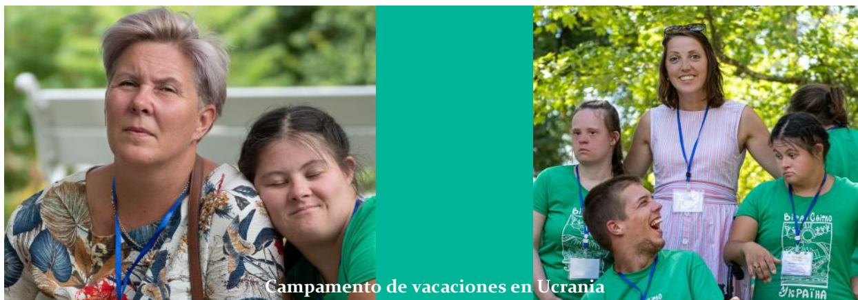
Campamento de vacaciones en Ucrania