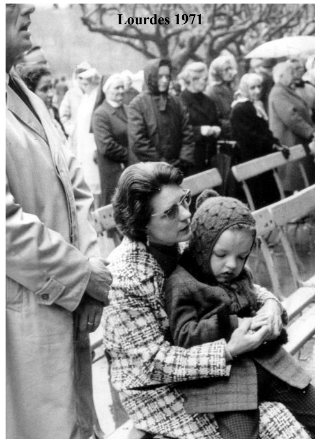
"Nunca mas solos", pagina 201