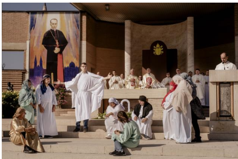
Las personas con discapacidad de la comunidad Noa de Županja, junto con sus amigos, revivieron el Evangelio de Lucas 11:27-28.

Una madre, una persona con discapacidad y dos jóvenes amigos dieron testimonio de lo que significa formar parte de una comunidad Fe y Luz: significa vivir en una comunidad llena de amor, salir del