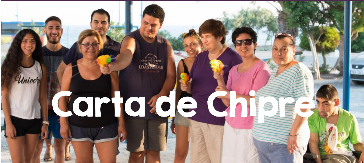
En Ayia Napa, durante un campamento de verano

E l mensaje de Fe y Luz llegó a Chipre hace 35 años, cuando, en septiembre de 1985 un grupo de jóvenes de las comunidades libanesas visitó la isla y se puso en contacto con algunas familias de la comunidad maronita con la idea de fundar comunidades en Chipre.