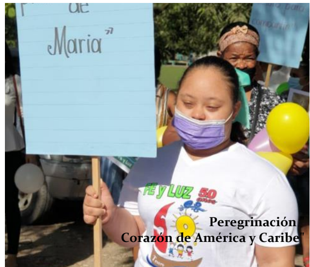
Peregrinación Corazón de América y Caribe

padres, acompañándolos, ayudándolos a crecer, protegiéndolos con entrega total y los amigos como yo, tenemos la bendición de compartir, sonreír, estar cerca, celebrar, cantar con ellos, sentir a Jesús en su presencia, hoy damos gracias a Dios por el regalo de ser parte de este maravilloso trio de amor.