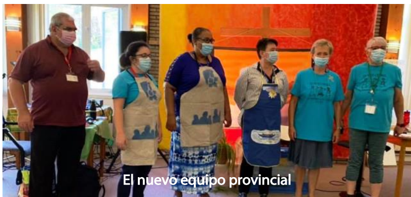
El nuevo equipo provincial