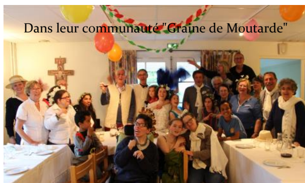
Dans leur communauté "Graine de Moutarde"