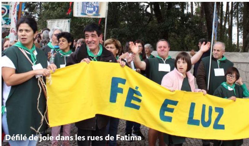
Défilé de joie dans les rues de Fatima

Tous les participants ont profité de divers moments, d'une séance de thérapie par le rire à des moments plus contemplatifs et spirituels comme la cérémonie du lavement des pieds, la célébration du pardon et de la lumière. Nous avons également participé à la prière du chapelet dans