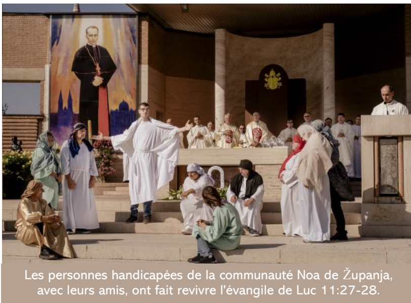
Les personnes handicapées de la communauté Noa de Županja, avec leurs amis, ont fait revivre l'évangile de Luc 11:27-28.

La première communauté croate formée avec le soutien de Foi et Lumière Slovénie, a embarqué sur le bateau et d'autres communautés ont suivi jusqu'à ce que le bateau soit plein, sous la protection de Jésus et de Marie.