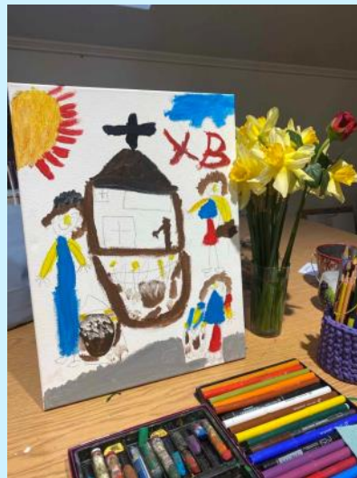
Yulia Kurylyak Ukraine