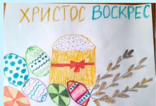
Havtur Ostap Ukraine