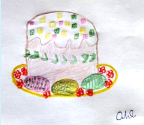
Olya Babii Ukraine