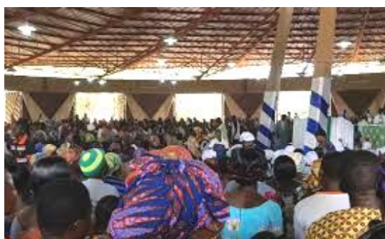
Eglise Ste Monique de Kombonlouaga

Avant de repartir, nous avons répertorié leur nom, leur adresse, élaboré le calendrier des réunions et planifié avec eux les activités de cette année. Nous essaierons de nous retrouver chaque premier samedi du mois.