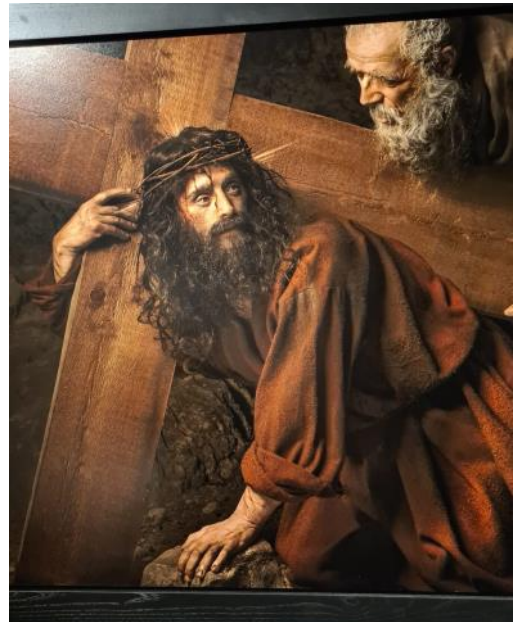
Interprétation du « Christ et le Cyrénéen » Titien Vecelio en 1560

Tania poursuit : « La croix ne doit pas être portée par Jésus seul, nous devons être aidés. Simon se tourne vers Jésus et lui murmure "Je suis là". Parfois, les parents se demandent pourquoi ils ont eu un enfant handicapé... Dans cet échange de regard se dégage de la douceur et de l'amour. ». De plus, « la main de Jésus posée sur la pierre rappelle le Golgotha mais aussi la fermeté de l'âme. Les rayons de lumière autour de la tête de Jésus représentent la présence de Dieu ».