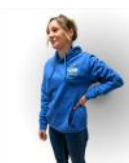
Sweat unisexe non zippé 40/42-44/46 20,00 € TTC