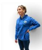
Sweat unisexe non zippé 40/42-44/46 20,00 € TTC