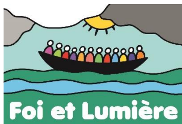
Logo officiel jusqu'en 2021