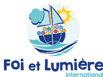
Mise à jour du logo septembre 2021

Le nouveau logo est conforme et fidèle à nos valeurs :